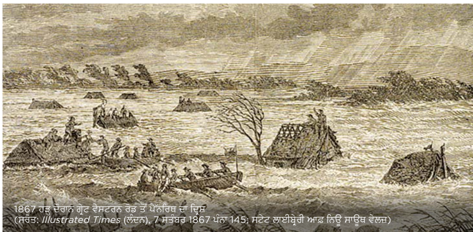
1867 ਹੜ੍ਹ ਦੌਰਾਨ ਗੁੱਟ ਵੈਸਟਰਨ ਰੇਡ ਤੋਂ ਪੈਨਰਿਥ ਦਾ ਦ੍ਰਿਸ਼

ਵੱਡੇ ਹੜ੍ਹ ਬਹੁਤੇ ਤਾਂ ਨਹੀਂ ਆਉਂਦੇ, ਪਰ ਜਦ ਆਉਂਦੇ ਹਨ, ਤਾਂ ਭਾਈਚਾਰਿਆਂ ਉੱਤੇ ਇਨ੍ਹਾਂ ਦੇ ਪ੍ਰਭਾਵ ਬਹੁਤ ਵੱਧ ਹੁੰਦੇ ਹਨ।