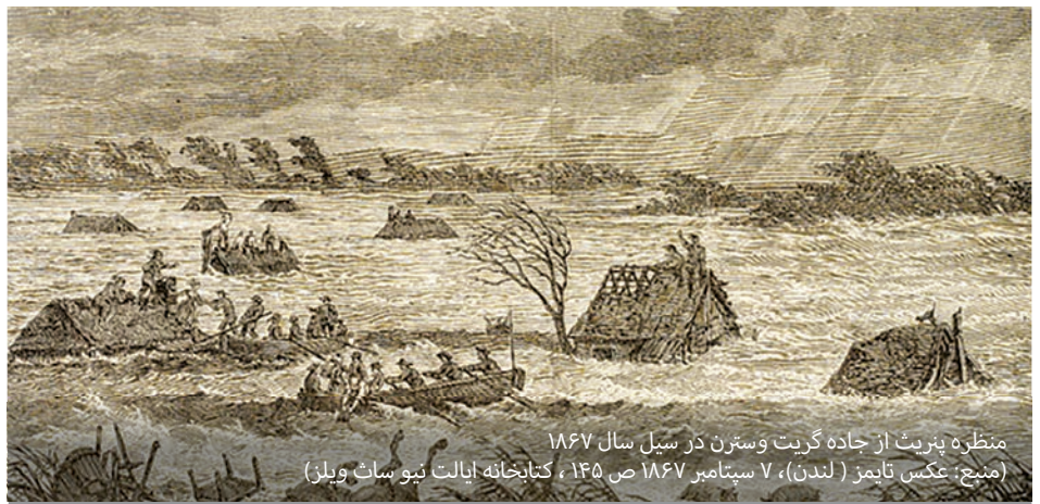
منظره پزیت از جاده گزیت وسترن در سیل سال ۱۸۶۷

شدیدترین سیل در حافظه زنده در نوامبر ۱۹۶۱ بود، وقتی که آب به ۱۴.۵ متر بالاتر از ارتفاع معمول رودخانه در ویندزور رسید. در این سیل کلاب قایق رانی و قایق موتوری نیپان خراب شد، پل یاراموندی واژگون شد و در سراسر دره هوکسبری - نیپان خرابی وسیع و گسترده ای رخ داد.